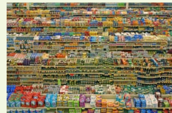
Le supermarché, temple de la (sur)consommation

Il est également possible d' investir dans des projets de production d'énergie renouvelable , comme le projet éolien citoyen des Ailes des Crêtes, dont nous avons souvent parlé. Vous pouvez être partenaire du projet dès 100 € et prêter de l'argent sous forme de compte courant d'associé à un taux de l'ordre de 2 % (soit bien mieux qu'un livret d'épargne). Le lien : http://ardennes-champagne.enercoop.fr/