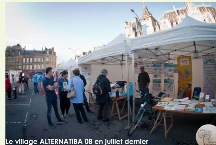
Le village ALTERNATIBA 08 en juillet dernier

Etes-vous à l'initiative ou partenaire d'un projet de votre territoire ?