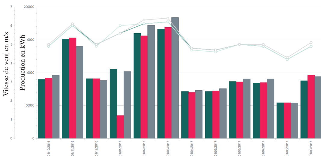
- Productions mensuelles des trois éoliennes et vitesses des vents -

Les éoliennes ont tourné 22 583 heures. Par conséquent la production n'a atteint que 3 644 MWh (équivalent consommation électrique, hors chauffage, de 1215 foyers). Même en ayant basé notre modèle économique sur un scénario hyper prudent (prévisions de 1600 heures à pleine puissance), nous sommes en dessous de nos objectifs de production. Il ne faudrait pas que cette situation dure trop longtemps !